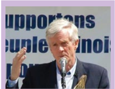
La dignité humaine et les Jeux Olympiques de 2008 Page 2