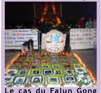
Le cas du Falun Gong Page 3