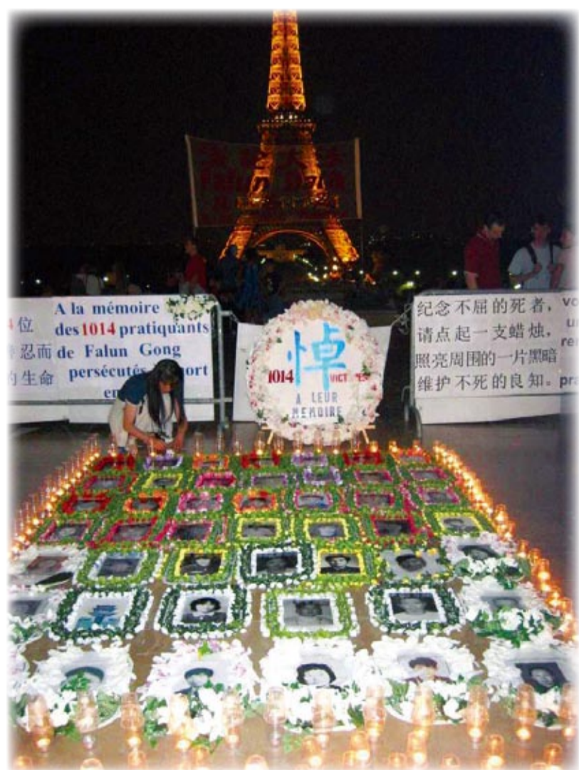
Commémoration des pratiquants de Falun Gong persécutés à mort en Chine, sur le parvis des droits de l'homme à Paris