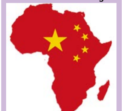
Relation sino-africaine, un vrai partenariat Gagnant-gagnant? Page 7