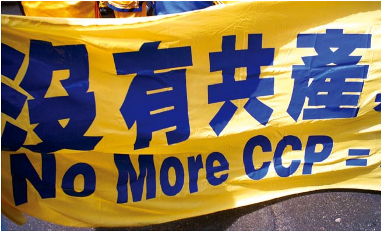
« Le PCC (Parti communiste chinois), plus jamais ! »

JOURNAL D'INFORMATION - GRATUIT - JUILLET 2008