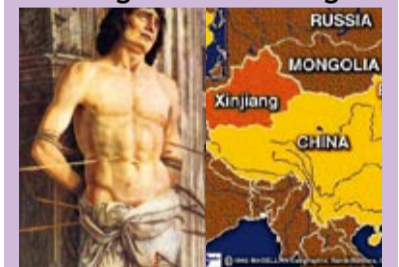
La persécution envers les religions en Chine Page 6