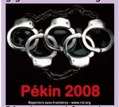
Réactions anti-françaises en guise de réponse à l'appel aux droits de l'homme Page 8