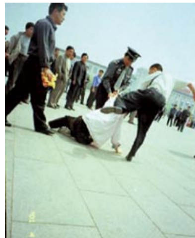
Une personne brandissant une banderole « Authenticité, Compassion, Patience » se fait tabasser par la police sur la Place Tian'anmen

Des milliers de pratiquants d'une discipline spirituelle en Chine ont été arrêtés et condamnés sans procès alors que Pékin jure « d'éradiquer » la dissidence avant les Olympiques.