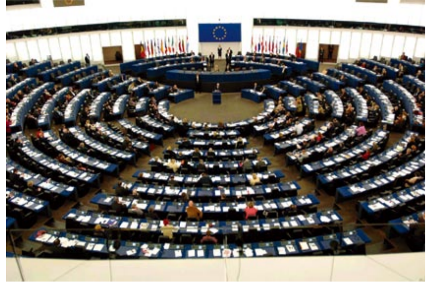
Plus de 700 membres du Parlement Européen élus parmi 25 états représentent 457 millions de citoyens