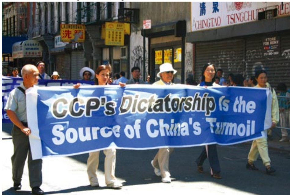
Des chinois émigrés aux Etats-Unis dénonçant le PCC lors d'une parade à New York portant une bannière disant: « La dictature du PCC est la source des troubles de la Chine »