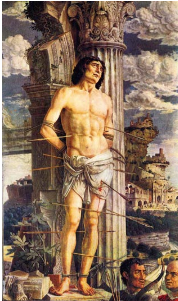
« Saint Sébastien », peint par Andréa Mantegna (1431-1506), reste le martyr symbolique, mais portant l'image d'une réalité en Chine face la persécution des chrétiens chinois