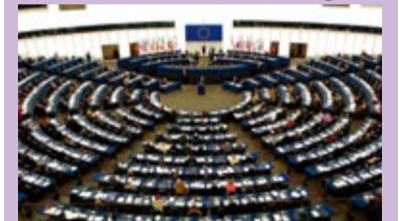
La Résolution du Parlement Européen Page 4